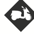
PERMIS 3 ROUES

Notre école de conduite dispose d'une piste située sur le parking du stade Parsemain à Fos-sur-Mer ;