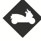
PERMIS MAXI SCOOTER